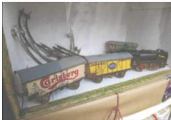
Flynderupgård Museets udstilling om julegaver holder åbent denne weekend fra 12 til 16.

22.00: Håndværkeren: Café Hulerock: Koncert med Deep Purple Jam