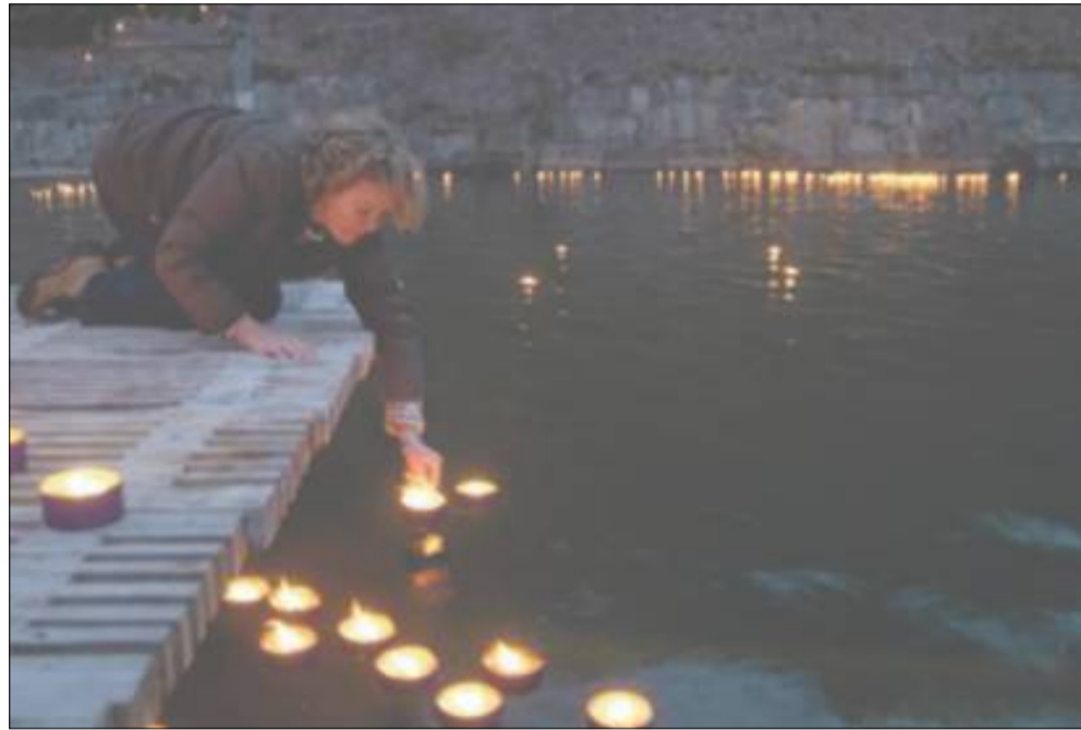
Snart vil byen funkke og glimte, når lysfestivalen og -konkurrencen Elsinore Lights sættes i gang.

Tanken bag konkurrencen er stadig, at alle kan nominere og alle lysinstallationer, lyssætninger og lysdekorationer kan nomineres, så længe de er placeret inden for kommunens grænser.